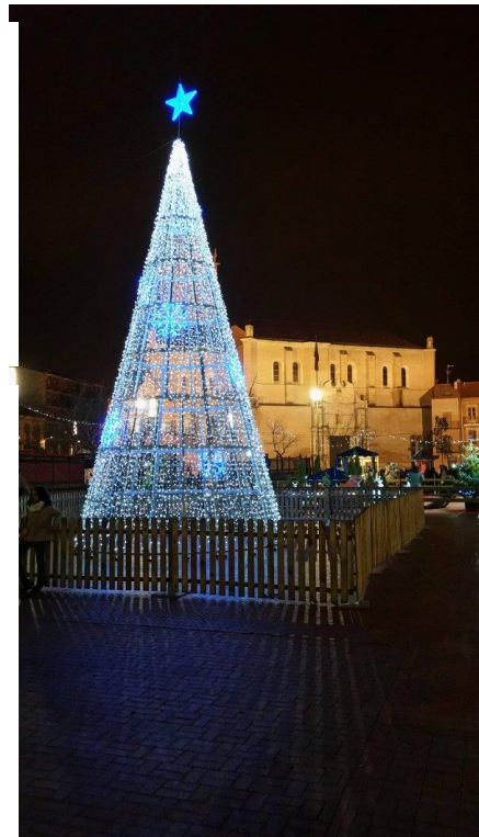
Decoraciones navideñas de la Plaza Mayor de Medina del Campo

La ventaja para la ciudad es que los tres principales corredores de transporte por carretera se cruzan cerca de la ciudad a saber, la autopista A6 entre Madrid y A Coruña; la autopista E80 desde Bilbao a Portugal a través de Burgos y Valladolid; y el Corredor del Duero A11 que une Zamora con Valladolid 1 . Galicia abrió una parada en Medina del Campo. Esto hará que el tiempo de desplazamiento al centro de Madrid (Estación Chamartín) a sólo 1 hora.