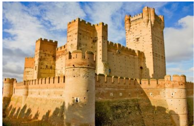
actualidad el completamente renovado Castillo de la Mota, cuenta con una sala de conferencias.

La preocupación es que estos edificios históricos y la Plaza Mayor no son visibles para los visitantes desde el punto de vista del Castillo, a causa de los bloques de apartamentos residenciales construidos en la década de 1970 que oscurecen la vista.